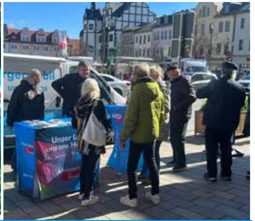
Unser Infostand am Gründonnerstag bei schönstem Osterwetter!