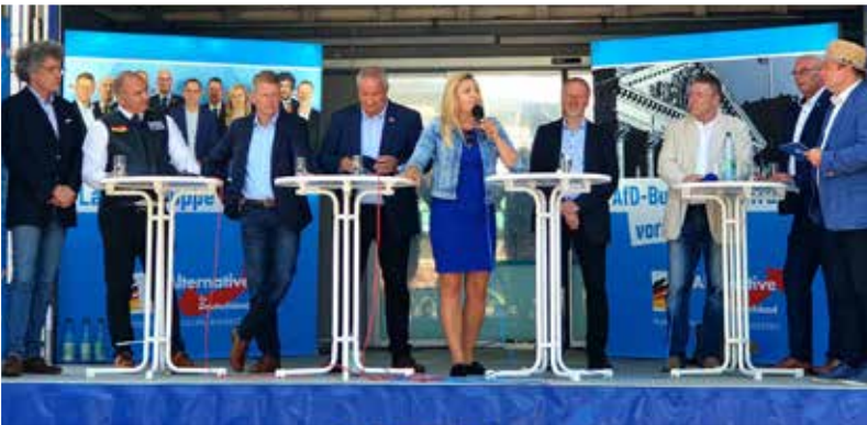
1. Juli 23: Zu Besuch bei der sächsischen Landesgruppe in der AfD-Fraktion im Deutschen Bundestag - auf dem Sommerfest der AfD Sachsen in Oberlungwitz