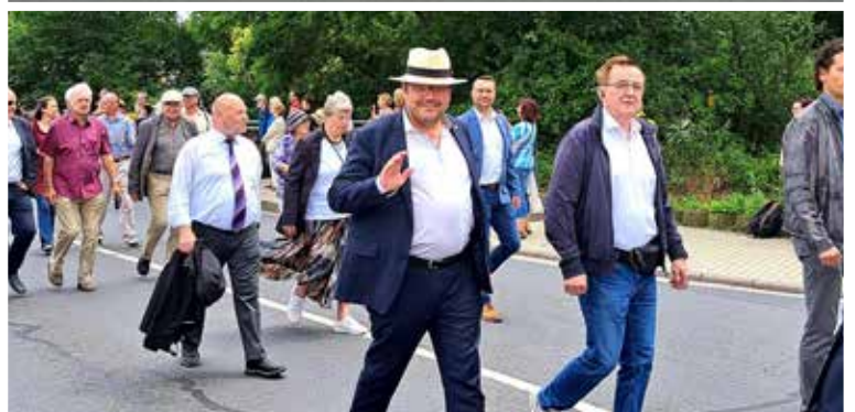
2. Juli 23: Bei bestem Wetter zog heute der Festumzug zum Lavendelfest durch Bad Blankenburg - vorn dran die neue Lavendelkönigin im Cadillac. Vielen Dank an die vielen hundert Teilnehmer aus Vereinen, Schulen, Kindergärten, Firmen etc., die den abwechslungsreichen Zug bildeten - und an tausende Zuschauer, die die Straßen säumten.