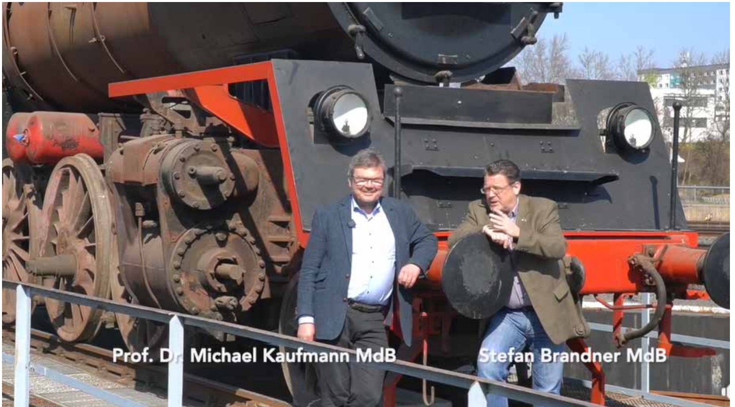
Prof. Dr. Michael Kaufmann MdB

Im Gespräch mit Stephan Brandner, MdB am Rande des Kreisparteitag des AfD Gera Jena SHK über die Haushaltswoche im Bundestag. Der Link zum Video: https://www.facebook.com/watch/?v=564115698473582